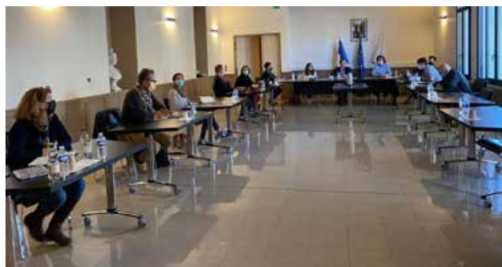
Quels modes de déplacements utilisez-vous le plus souvent sur la commune ?

Cette enquête a été réalisée auprès des habitants et une centaine de personnes ont ainsi contribué à l'étude à travers leurs remarques et propositions. La Région Occitanie, le Parc Naturel Régional du Haut Languedoc, le Pays Haut Languedoc et Vignobles, la Banque des Territoires, le CAUE étaient présents pour valider cette étude. Elle a été financée par la mairie et La Région Occitanie avec l'accompagnement du Pays Haut Languedoc et Vignobles.